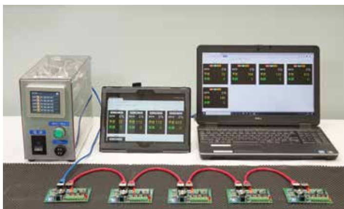
IoTスマートデータシステム