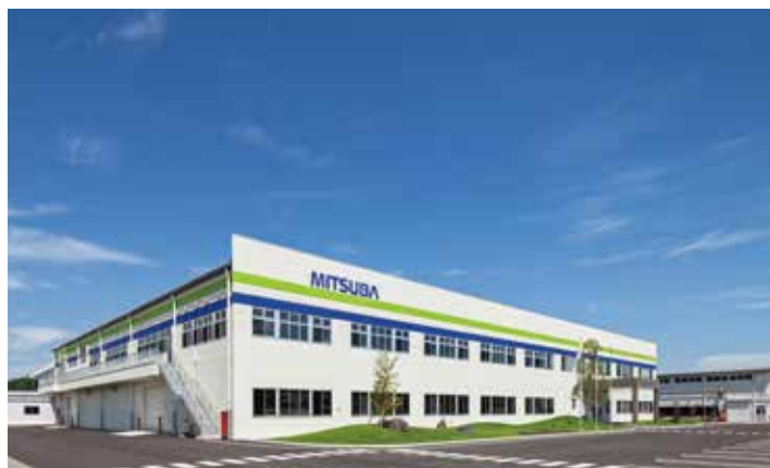
(株)ミツバ富岡工場