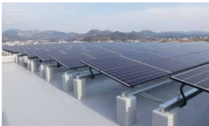
某社屋上太陽光発電設備