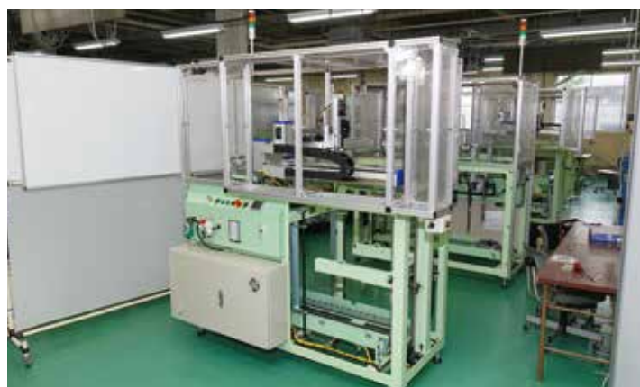
アクティブタイザー