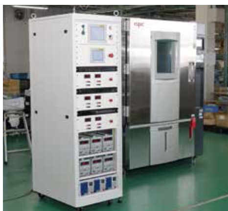
冷熱耐久試験装置