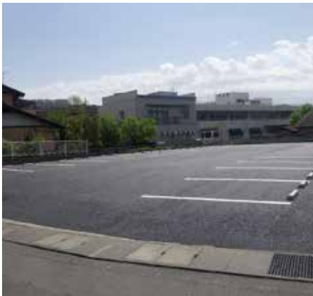
某社駐車場整備工事