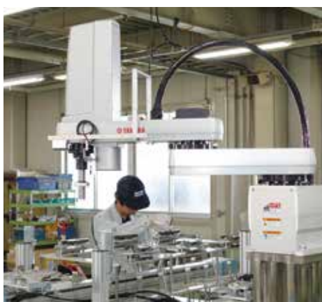
自動取り出し整列機